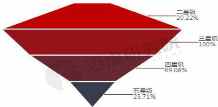
2023年全国星级酒店结构漏斗图

根据迈点研究院整理数据显示，2023年第一季度通过审核的星级酒店共计6324家，四星和三星最多，分别占比为32.08%、32.08%，我国星级酒店结构从传统的“金字塔”型向“橄榄型”转变过渡，酒店中高端化升级趋势明显。